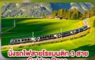
นั้งรถไฟสายโรแมนติก 3 สาย Golden Pass / Luzern Interlaken Express / Gornergrat