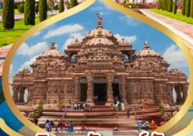
วิหารอักขารัติม