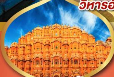
พระราชวัง สยาม