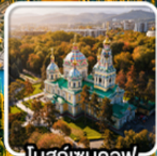
โบสถ์เซนคอฟ

นั่งกระเช้าคอนโดล่าขึ้นสู่ชิมบูลัก สทึร์สออร์ก ไข่มุกแห่งเทือกเขาเทียนชาน ทะเลสาบโคลโซ หุบเขาเจดี โอกูซ / ภูเขาหินเทพนิยาย / ทะเลสาบอัสซิกกุล ชมการแสดงการล่าเหยื่อของนกออินทรีย์