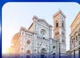
ชมเมืองแห่งศิลปะ ฟลอเรนซ์