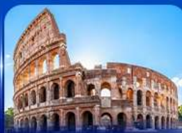
เชิควินดัง โคโลสซียม โรม