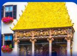
หลังคาทองคำ อินส์บรุค