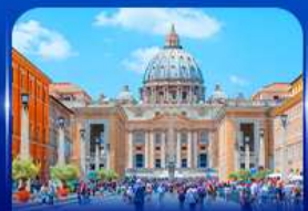
นครรัฐวาติกัน โรม