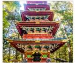
ศาลเจ้าโทโฮกุ