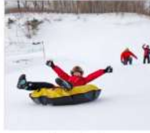
เล่นสโนว์ทูบ