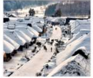
หมู่บ้านโบราณโอะอุจิจุด