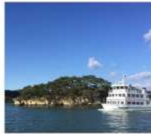
ล่องเรืออ่าวมัตสึชิม่า