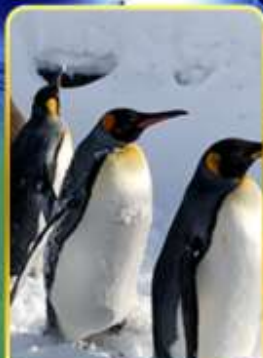
พาเหรดกเพนกวิน