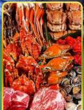
ปิ้งย่างพรีเมียมมันตะ

🔥 ออนเซ็น 2 คั้น 🧳 มน.กระเป๋า 1 ใบ 23 กก 🌞 7Days 5Night