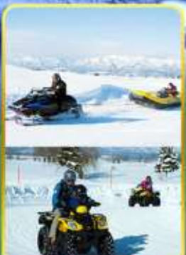
BIBAI SNOW LAND