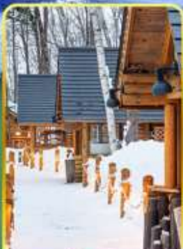
มิงเกิ้ลเกอเร