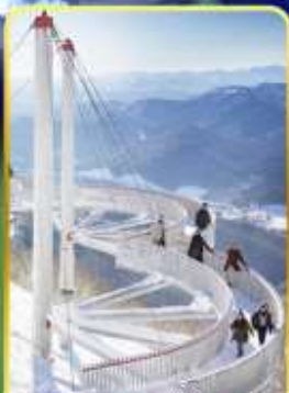
ระเบียงหมอกน้ำแข็ง