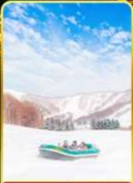
กิจกรรมโนว์ราฟติง