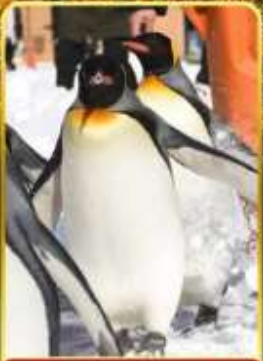
มิทซ์มารีนพาร์ค