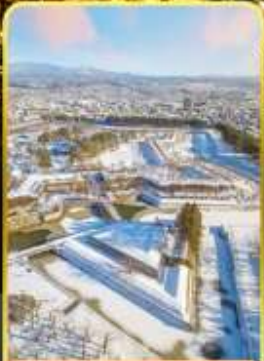
หอดาวห้าแฉก

🌊 ออนเซ็น 3 คั้น 🧳 มน.กระเป๋า 1 ใบ 23 กก 🌞 7Days 5Night