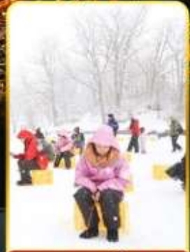
ตกปลาน้ำแข็ง