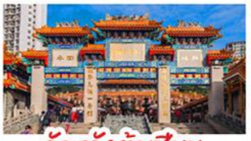
วัดเขว้งต้าเซียน

เมนูพิเศษ! ติ่มซำฮ่องกง, ห่านย่าง และอาหารชาบู