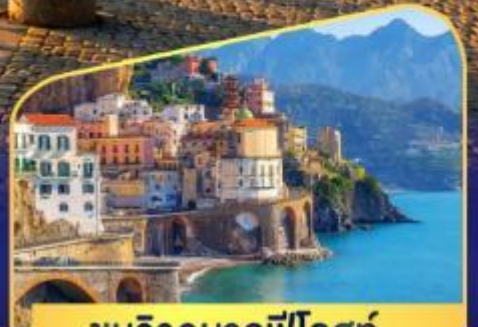
ชมวิวมอลฟีโคสก์