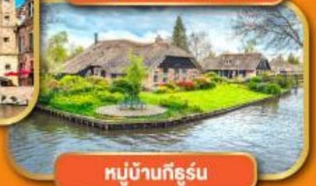
หมู่บ้านก็ธูร์น