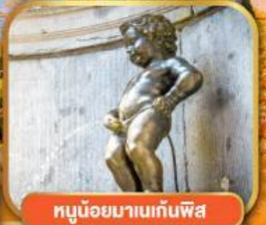
ทูน้อยมานเทินพิส