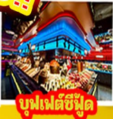
บูฟเฟต์ซีฟู้ด