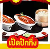
เปิดปิ้งกั๊ง