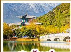
สระมังกกรถ้ำ