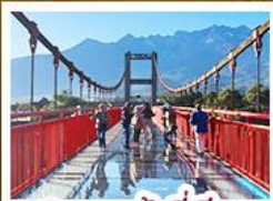
สะพานแก้วลี้เจียง