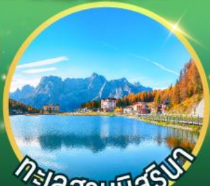
ทะเลสาบบิสุงนา