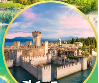
ซิริมิโอเน