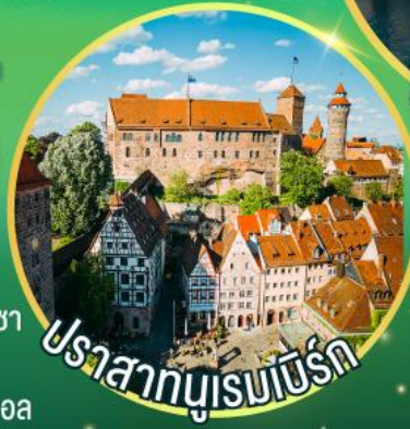
ปราสาททิวเรนเบิร์ก