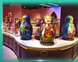
พิพิธภัณฑ์ ตุ๊กตาเป่ลือกด