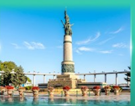
อนุสาวรีย์มังกร