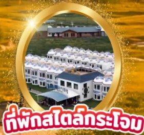
ที่พักไฮไลต์