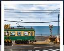
รถไฟโอบะเด็น