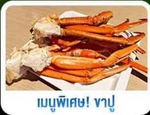
เมนูพิเศษ! ซาซิมิ