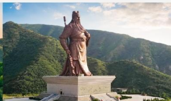
บ้านเกิดท่านกวนจู