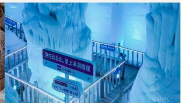
ถ้ำน้ำแข็งอ้วนชีวซาน

*ทางบริษัทฯ ขอสงวนสิทธิ์ในการสลับโปรแกรมทัวร์ตามความเหมาะสมขึ้นอยู่กับสถานการณ์หน้างาน โดยคำนึงถึงผลประโยชน์ของลูกค้าเป็นสำคัญ