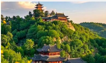
เขาเหยาหวังชาน