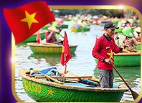
เรือกระด้ง หมู่บ้านกิมทาน