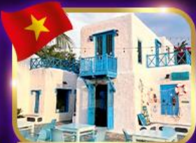
คาเฟ่สุดชิค ซานทรา มาริน่า