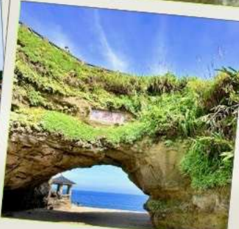
ถ้ำสี่เหมิน