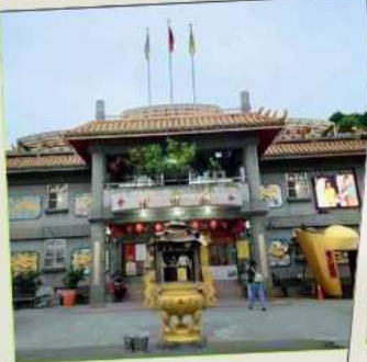
วัดจินซาน (โซคลาก)