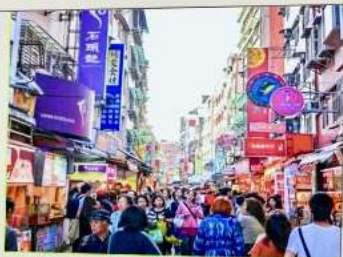
ถนนโบราณตี๋นฮุย