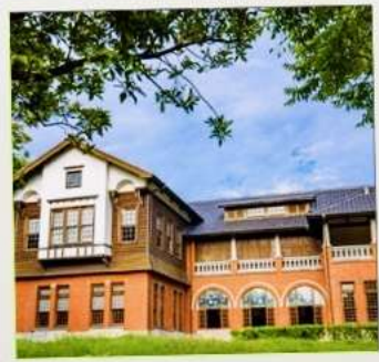
พิพิธภัณฑ์น้ำพุร้อนเป่ย์โถว