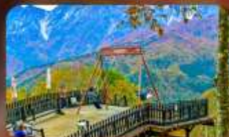
ฮาคุบะ-อิวาทากะ