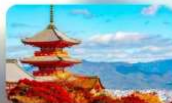
วัดคิโยมิชิ