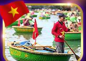
เรือกระด้ง หมู่บ้านก๊อ๊กทาน