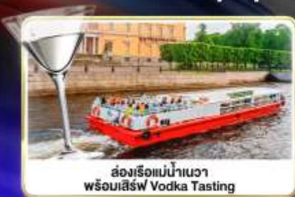
ล่องเรือแม่น้ำเนวา พร้อมเสิร์ฟ Vodka Tasting