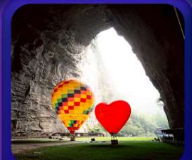
“ ถ้าถึงหลง ”