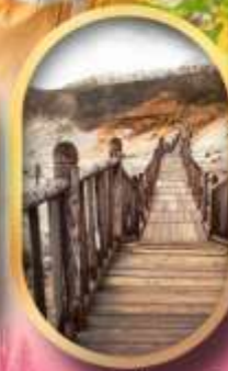
หุบเขาจิกุกุคาบิ