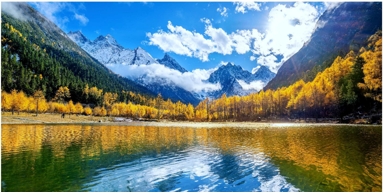
T2G-TFU25SL Basic Chengdu...เจียงตู สีดรุณี ปี่ผิงโกว 4D 3N (SL)

เช้า รับประทานอาหารเช้า ณ ห้องอาหารของโรงแรม