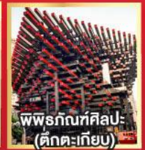
พรภักดิ์ศิลปะ (ตึกตะเกียบ)