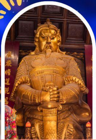
วัดแซกง ขอพรโชคกลาง การเงิน และธุรกิจ