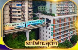
รถไฟฟ้าสุดึก