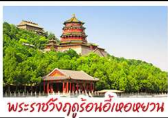
พระราชวังฤดูร้อนอ้าหอยวน

ท่าแพงเมืองจินด่านจวียงกวน - พระราชวังฤดูร้อนอ้าหอยวน สวนจิ้งอัน - วัดลามะ - ไม่ลงร้านช้อปปิ้ง - โรงแรม 4 ดาว มือพิเศษ เปิดปีกัง สุกิมองโกล MICHELIN GUIDE ร้าน TAO TAO JU