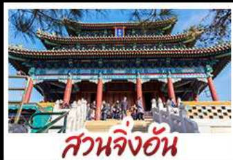
สวนจิ้งอัน