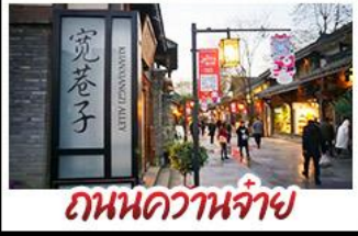
ถนนความจำ