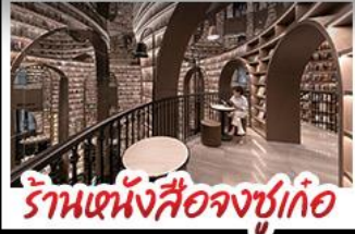
ร้านแห่งสี่งจูกอ

อุทยานภูเขาสี่ดรุณี อุทยานป่าเขิงโกว หมู่แพนด้าอนเซลพี ภัตตาคารสี่งจูกอ วัดต้าฉือ ถนนโบราณความจำ ซุปปังย่านคิง ถนนไท่กูหลี่ + ถนนซุนซู่ เมนูพิเศษ สุกี้หมาล่าเสวน