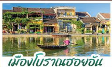
เมืองโบราณเฮอฮอัน

! พักบนเขานาฮิลล์ 1 คืน ! สัมผัสอากาศเย็นตลอดปี สตรีตฟรังเศสสุดคลาสสิก - นั่งกระเช้ายาวที่สุด สู่มานาฮิลล์ สนุกสุดมันส์ไปกับสวนสนุก The Fantasy Park มันิสการเจ้าแม่กวนอิมองค์ใหญ่ที่สุดของเมืองดานัง - เช็กอินเมืองมรดกโลกฮอยอัน - สนุกสนานไปกับกิจกรรม!!นั่งเรือกระดิง หมู่บ้านกัมถาน เช็กอินร้านกาแฟ SON TRA MARINA CAFE - ไม่หลงร้านช้อปปิ้ง - อิ่มอร่อยกับบุฟเฟ่ต์นานาชาติ , หม้อไฟซีฟู้ด