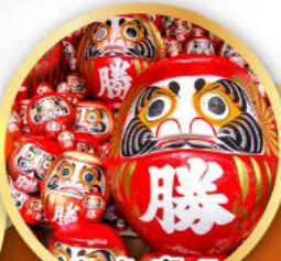
วัดคัตสึโฮจิ (วัดดามะ)

ชมความงามของกำแพงหิมะ เส้นทางสายอัลไพน์ทาเคยาม่า (JAPAN ALPS SNOW WALL)