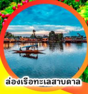
ล่องเรือทะเลสาบดาล