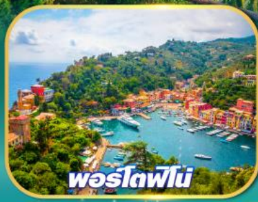
พอร์ตฟีโน