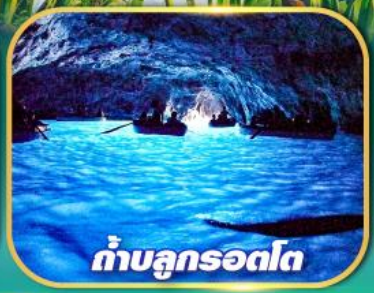
ถ้ำบลูกรอดโก