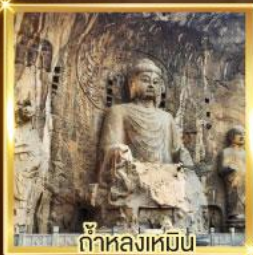
ถ้ำหลงเหมิน