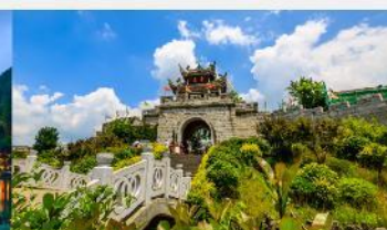
เมืองโบราณซิงเหยียน

*ทางบริษัทฯ ขอสงวนสิทธิ์ในการสลับโปรแกรมทัวร์ตามความเหมาะสมขึ้นอยู่กับสถานการณ์หน้างาน โดยคำนึงถึงผลประโยชน์ของลูกค้าเป็นสำคัญ