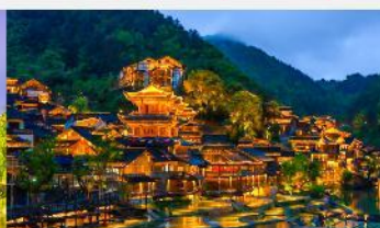
หมู่บ้านโบราณฉูเจียงจ้าย