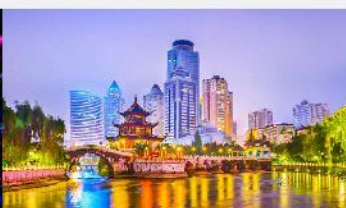
หอเจี่ยเซียวไหลว