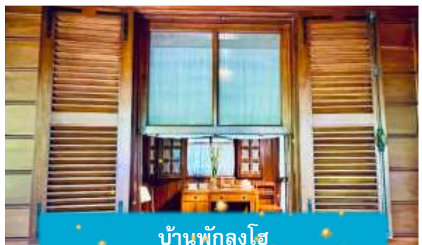
บ้านพักลุงโฮ