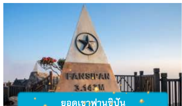
ยอดเขาฟานซีปัน