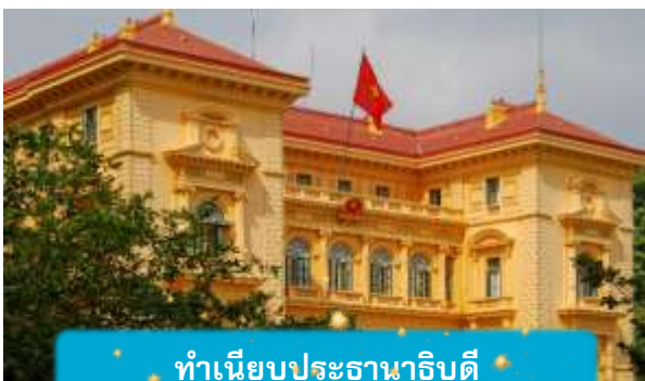
ทำเนียบประธานาธิบดี

เช้า บริการอาหารเช้า ณ ห้องอาหารของโรงแรม นำท่านถ่ายรูปด้านนอก สุสานโฮจิมินห์ จุดเริ่มต้นของการเข้าใจเวียดนาม สถานที่อันเงียบสงบที่สะท้อนจิตวิญญาณของผู้นำผู้ยิ่งใหญ่ สุสานแห่งนี้ไม่ได้เป็นเพียงอนุสรณ์ แต่คือบทเรียนประวัติศาสตร์ที่สัมผัสได้จริง นำท่านเดินทางสู่จุดศูนย์กลางแห่งประวัติศาสตร์เวียดนาม นำชมด้านนอก ทำเนียบประธานาธิบดี อาคารสีเหลืองอร่ามในสไตล์ฝรั่งเศส ที่ยังคงใช้ในพิธีการสำคัญของชาติและชม บ้านพักลุงโฮ บ้านไม้เรียบง่ายริมสระบัว ที่เผยให้เห็นชีวิตสมณะของผู้นำผู้ยิ่งใหญ่ "โฮจิมินห์" สองสถานที่ สองเรื่องราวที่สะท้อนความเป็นเวียดนามอย่างลึกซึ้ง ไม่ใช่แค่ท่องเที่ยว แต่คือการเข้าใจจิตวิญญาณของประเทศนี้อย่างแท้จริง เที่ยง บริการอาหารกลางวัน ณ ภัตตาคาร