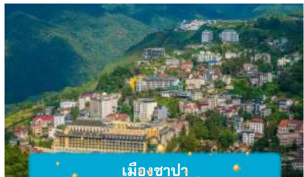
เมืองซาปา