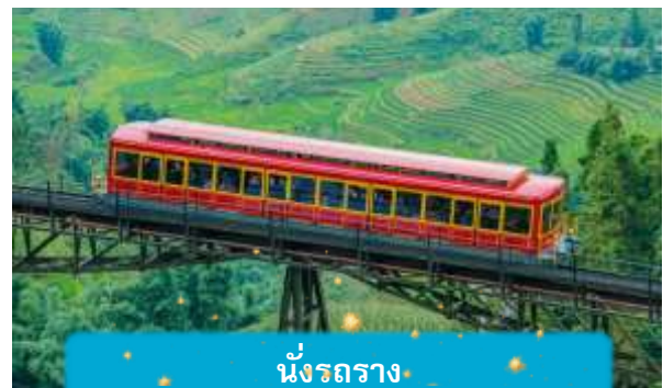
นั่งรถราง

เที่ยง บริการอาหารกลางวัน ณ ภัตตาคาร พิเศษ ... เมนูบุฟเฟ่ฟานซีปัน