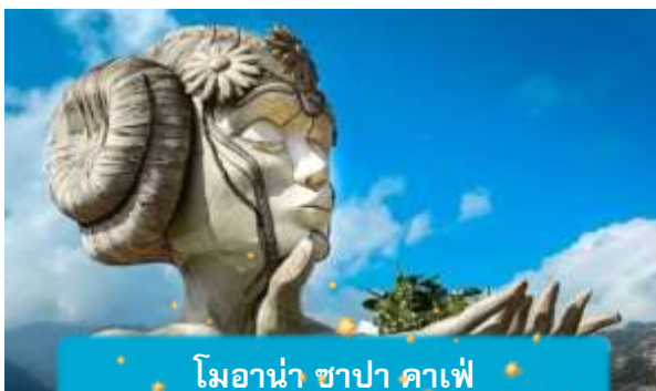
โมอาน่า ซาปา คาเฟ่

เย็น บริการอาหารค่ำ ณ ภัตตาคาร พิเศษ ... เมนูหม้อไฟแชลมอน + ไวน์แดง ที่พัก SAPA CHARM HOTEL ระดับ 4 ดาวมาตรฐานท้องถิ่น หรือเทียบเท่า