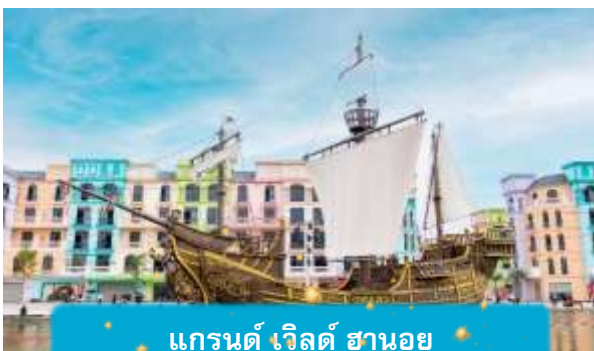
แกรนด์ เวิลด์ ฮานอย