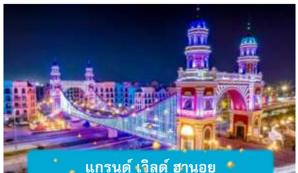
แกรนด์ เวิลด์ ฮานอย