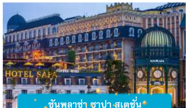
ชั้นพลาซ่า ซาปา สเตชั่น