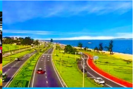
ถนนหวนเต่าลู่