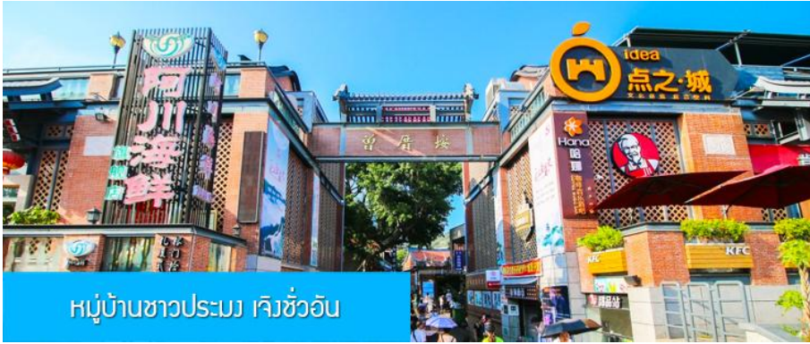
หมู่บ้านชาวประมง เจิงชว้ออัน