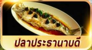
ปลาประธานาธิบดี