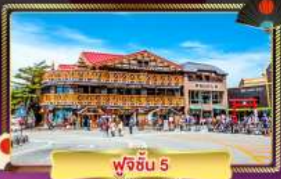
ฟุจิชั้น 5