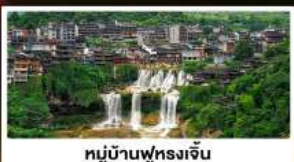
หมู่บ้านฟุทงเจิน