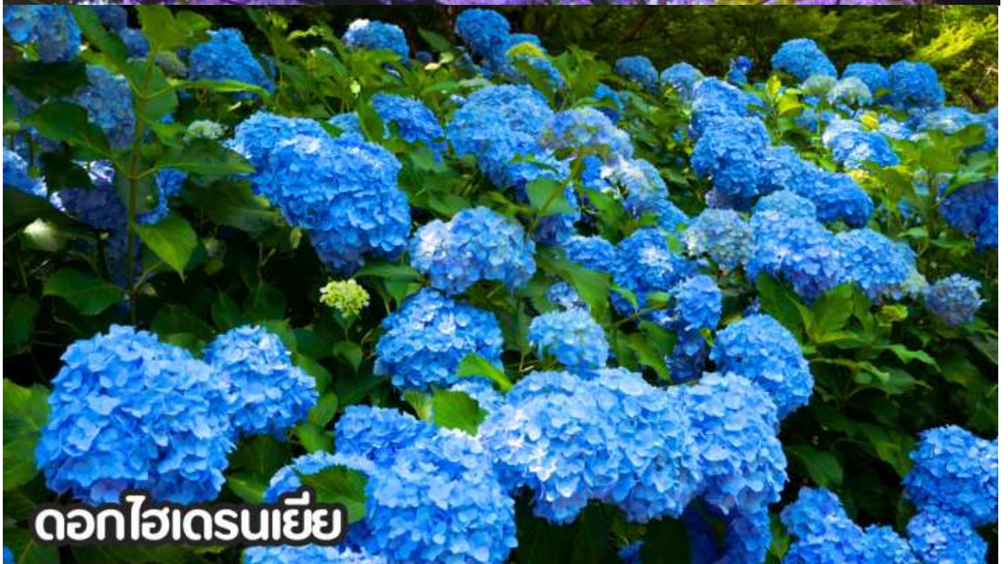
ดอกไฮเดรนเยีย

**หมายเหตุ: โปรแกรมชมดอกไม้ช่วงเดือน พ.ค. - ต.ค.2569 ในช่วง ณ วันเดินทางดังกล่าว หากดอกไม้ยังไม่บานหรืออาจจะร่วงหล่น..ทั้งนี้ขึ้นอยู่กับสภาพอากาศของแต่ละปี ทางบริษัทไม่การันตีและไม่สามารถกำหนดการบานของดอกไม้ได้ ทางบริษัทฯ ขอสงวนสิทธิ์ปรับเปลี่ยนรายการท่องเที่ยวอื่นทดแทนนะคะ รบกวนท่านโปรดทราบและทำความเข้าใจค่ะ**