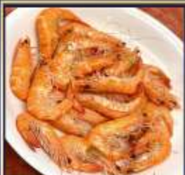
กุ้งหวานลวก