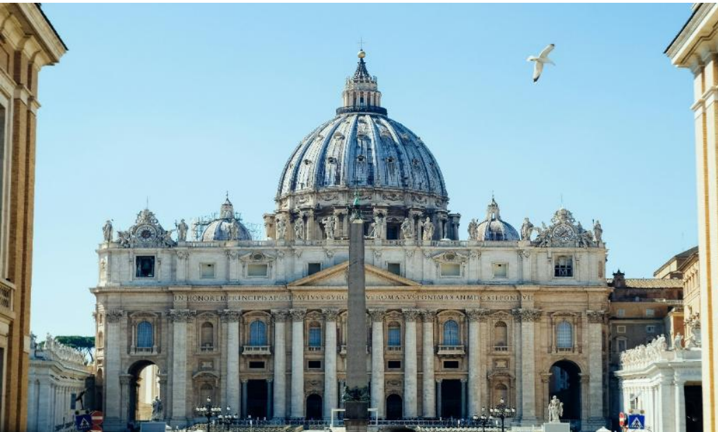
มหาวิหารนักบุญปีเตอร์ ( ST. PETER' BASILICA)

(กรณีมีพิธีด้านใน หรือถ้าหากมีผู้เข้าชมเป็นจำนวนมากจนไม่สามารถเข้าชมได้ทันเวลา ทั้งนี้เพื่อมิให้กระทบต่อกำหนดการท่องเที่ยวอื่นๆ ภายในโปรแกรมทัวร์" อาจจะไม่ได้รับการเข้าชม)