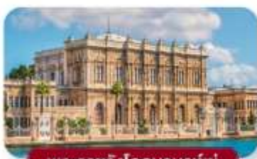
พระราชวังโดลมาบาห์เซ่