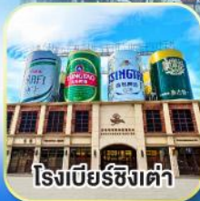
โรงเบียร์ซิงเต่า