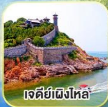
เจดีย์เหิงไห่