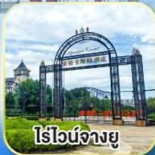
ไร่องานฉาย