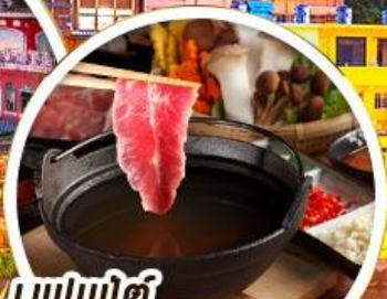
บุฟเฟ่ต์ ซาบูทหม้อไฟไต้หวัน